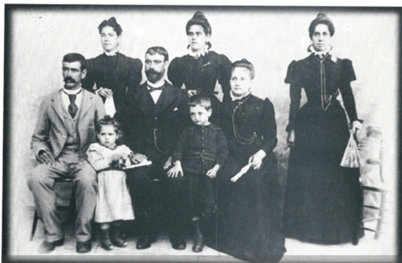
Retrato de Familia (Granadilla de Abona.)

y el cuestionamiento de la utilidad de las enseñanzas. Así, por ejemplo, en 1908 se denunciaba en La Opinión cómo 50 niñas en un pueblo se veían perjudicadas al interrumpirse las clases durante 19 días, para que la maestra preparase en la Iglesia a unas cuantas que se lucieran en una velada cultural cantando con acompañamiento de órgano. Y así, podía leerse en la prensa "se dio una velada, para lucir sus habilidades, tres o cuatro niñas de padres adinerado, sacrificando para esto a muchas niñas que no han recibido clase...que el Gobierno para a los empleados para que cumplan sus deberes sin contemplaciones particulares" . Exigía el crítico vecino el restablecimiento de las clases diarias y no veladas innecesarias, concluyendo con un "Mucha instrucción hace falta por ahora para ganar aquel precioso tiempo perdido en que estuvo clausurada la Escuela por falta de casa" .