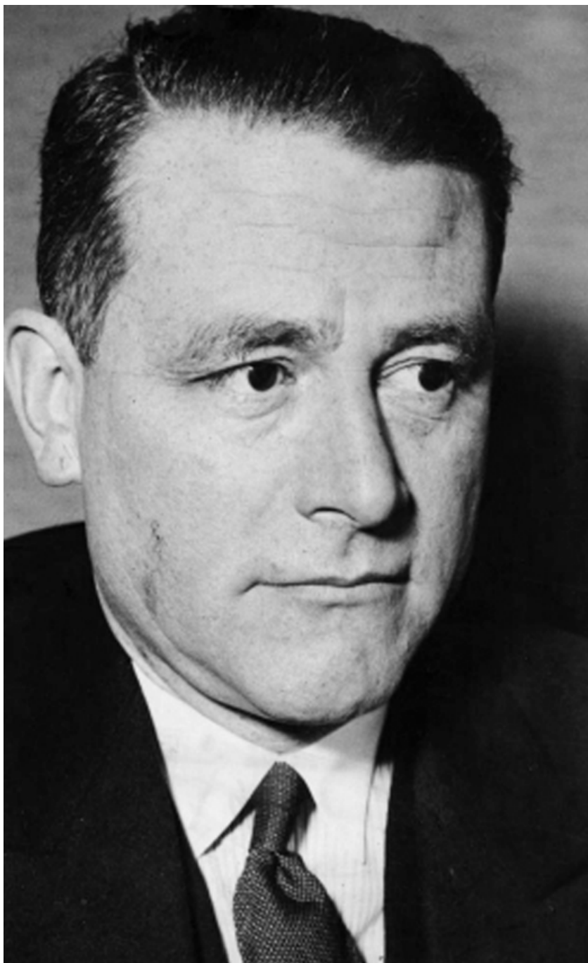
Carl Schmitt (1888-1985)