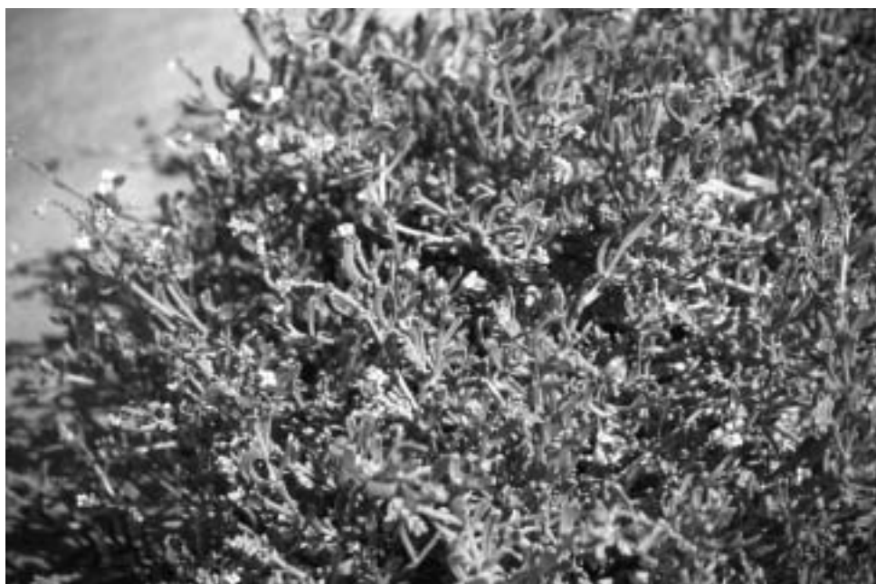
Fig. 1 Cakile marítima Scop. subsp. marítima

propia de una ecoforma, e incluíble dentro de la multiplicidad de formas que presenta una especie tan diversa morfológicamente como Cakile marítima .