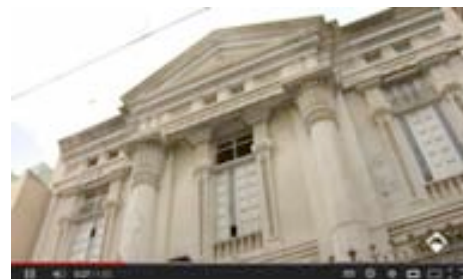
El único templo masónico de España está en Tenerife

[Vídeo emitido por Antena 3 Canarias el 24 de abril de 2012, sobre el Templo Masónico de Santa Cruz de Tenerife. Disponible en Youtube].