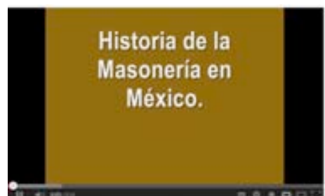
Historia de la Masonería en México 1

http://www.youtube.com/watch?v=fCecNx5q3LE