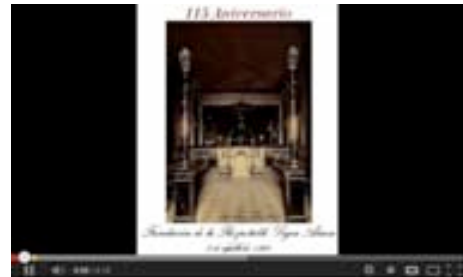
115 aniversario de la Respetable Logia Añaza. Puedes leer

[Presentación en diapositivas que conmemora el 115 aniversario de la Respetable Logia Añaza. Con fotografías antiguas y actuales de los miembros de la logia y del Templo Masónico de Santa Cruz de Tenerife].